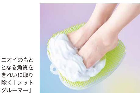
ニオイのもととなる角質をきれいに取り除く「フットグルーマー」

*当日は、読売新聞に取材いただき、キューバの研修員が同社を訪問し、日本の中小企業の経験を学んだと紹介されました。