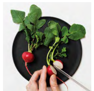
CHOPLATE まな板になるお皿