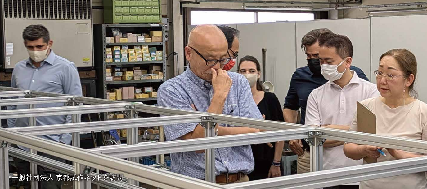
一般社団法人 京都試作ネットを訪問