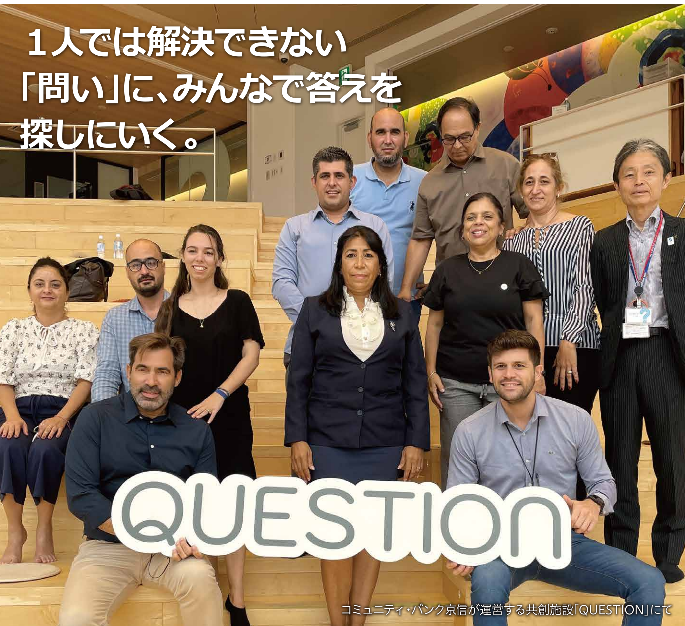
コミュニティ・バンク京信が運営する共創施設「QUESTION」にて